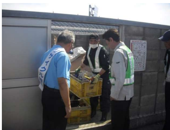
(環境パトロールの様子)