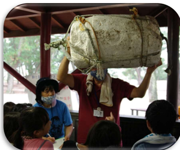
海岸清掃をしよう！「おもしろごみひろった選手権」の様子